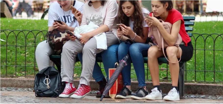
Un grupo de adolescentes con el móvil.

La protección del menor en internet y las redes sociales es uno de los principales retos a los que se enfrentan las instituciones y la sociedad en general en la actualidad.